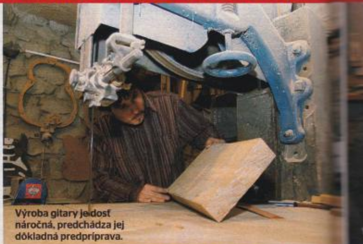
Výroba gitary je dosť náročná, predchádza jej dôkladná príprava.

mína geológ na obdobie, keď sa ho zmocnila myšlienka, že chce vyrábať gitary. „Sám som hral na gitare a už ako chalan som dokázal na nej niečo opraviť, zlepšiť. Tak prečo si nejakú