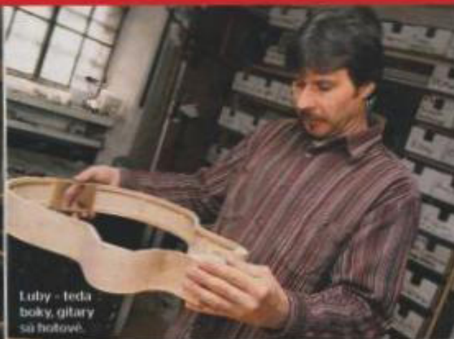
Luby - teda boky, gitary sa hotové.

nevyrobí? V tom čase sa však výroba hudobných nástrojov u nás nedala študovať, hoci nejaké pokusy tu boli. V istom časopise som objavil inzerát inštitútu The Roberto-Wenn Schöll of Luthieri, ktorý ponúkal možnosť naučiť sa vyrábať akustické a elektrické gitary. Žiaľ, po-